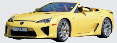
レクサス LFA スパイダー (2012年)