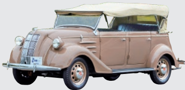
トヨタ AB型フェイトン (1938年)