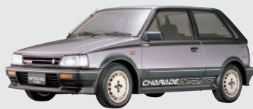
協力:ダイハツ工業株式会社 ダイハツ シャレード デトマン (1984年) ダイハツ ハイゼットバン (1961年)