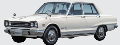
協力:日産自動車株式会社 ニッサン スカイライン 2000GT (1970年)

今年は当館車両だけでなく、国内自動車メーカーと連携し車両展示や走行披露を行います。ぜひ走る姿をご覧ください。記念撮影もお楽しみください。