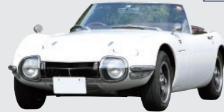
トヨタ 2000GT ロードスター (1967年)