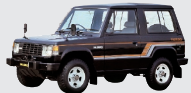
協力:三菱自動車工業株式会社 三菱 パジェロ (1982年) 三菱 デiamondテ (1990年) 三菱 ランサーエボリューション (1992年)

公道パレード走行 走行披露(11:30~12:30) 乗車記念撮影(9:30~11:00、13:00~14:30) 記念撮影