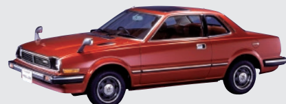
ホンダ プレリュード(1978年)