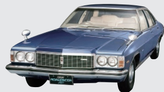
協力:マツダ株式会社 マツダ ロードペーサー AP (1975年)