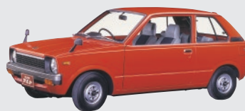
協力:スズキ株式会社 スズキ アルト (1979年)