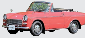
トヨタ パプリカ コンバーチブル (1965年)